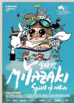
Selectionné à la MOSTRA DE VENISE Venice Classics 2024